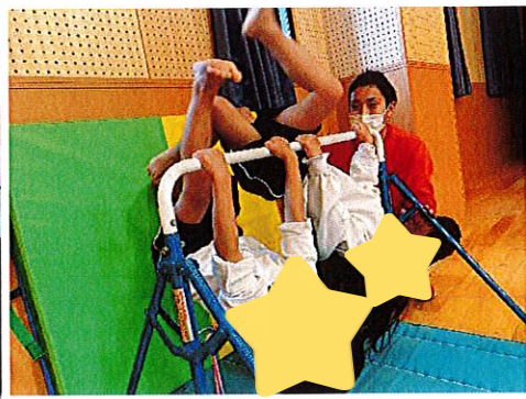
逆上がり、練習中です!!