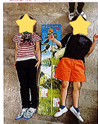
僕たちとひまわり、背が高いのはどっち?