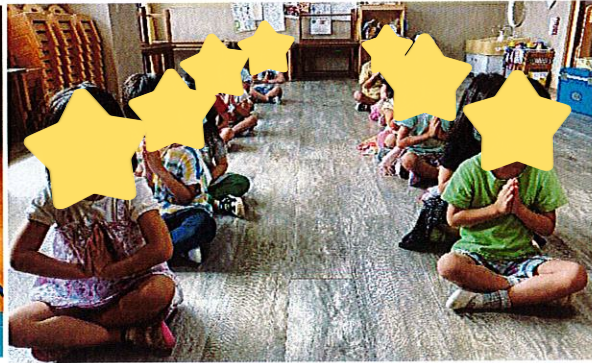
かっこよくなる修行をしています!