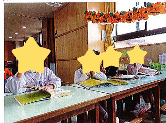
絵本が大好きなきく組さんたち☆