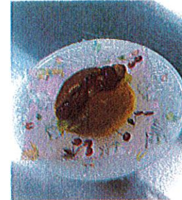
ホットドッグ 子どもサイズの ホットドッグめ 食べやすさバロリ♡

今年度のお誕生日会やハロウインの特別なおやつを少し紹介します☆ 次はどんなおやつかな！？誕生日がまだのお友達は楽しみにしてください！！