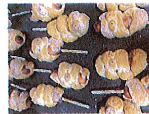
マミーウインター ゴマで目を付けて ミイラに☆ 「おいしかった」と 言っていたにほ♡