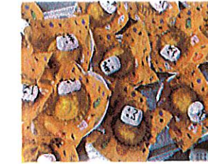
ハロウイン かぼちゃのカップケーキめ マッシュマロ(オバケに♡ いずり顔が違います!! ♡の目が当たった子(オバケ…!)