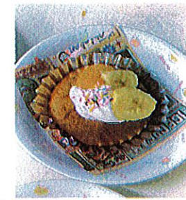
マドレーヌ トッピンがにほ バナナとみかんと生クリームめ 生クリームにほ カラースプレーも♡