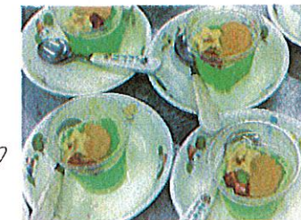
マスカットゼリーの フルーツポンチ よく見ると スイカが ハートと星の形に…♡